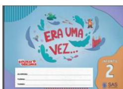
ERA UMA VEZ ... – LIVRO ANUAL