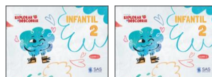
LIVROS INTEGRADOS – (2 LIVROS)