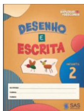
DESENHO E ESCRITA – LIVRO ANUAL

ATENÇÃO: MATERIAL ADQUIRIDO EXCLUSIVAMENTE NA ESCOLA: PORTUGUÊS: SISTEMA ARI DE SÁ / INGLÊS: OXFORD